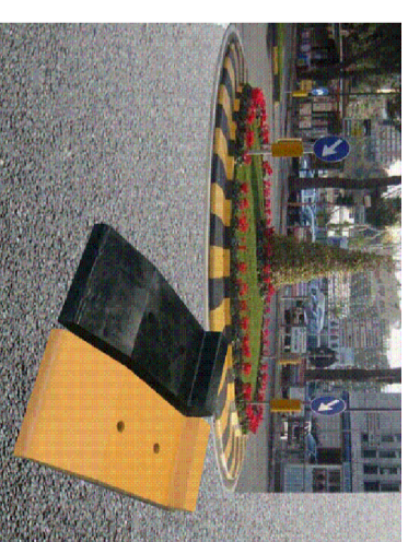
3) montažni PVC rubnjaci kružnog toka