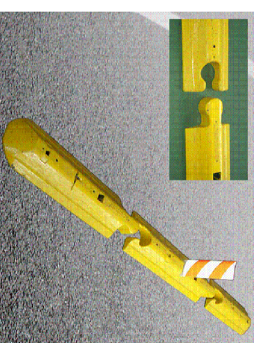
1) montažni PVC rubnjaci za usmjeravanje prometa