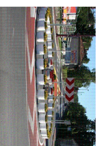
4) PVC I/II BETONSKE ŽARDNIJERE Ø100, l= 50cm